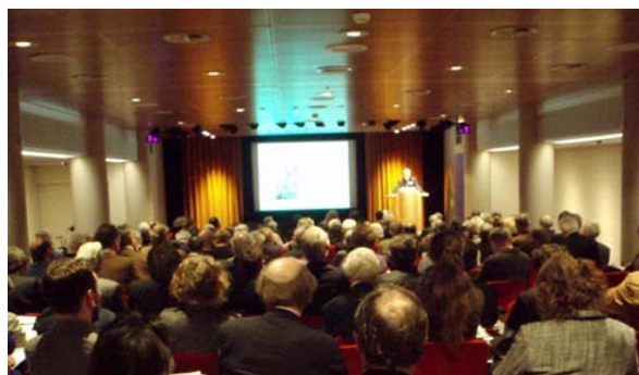
Volle zaal bij OVN congres.

Om de interdisciplinaire uitwisseling van kennis en onderzoeksresultaten op het vakgebied te stimuleren, organiseert de stichting OVN regelmatig lezingen, cursussen en congressen. Met deze activiteiten beoogt de stichting beheerders van maçonnieke en esoterische collecties, studenten en academici, erfgoeddeskundigen