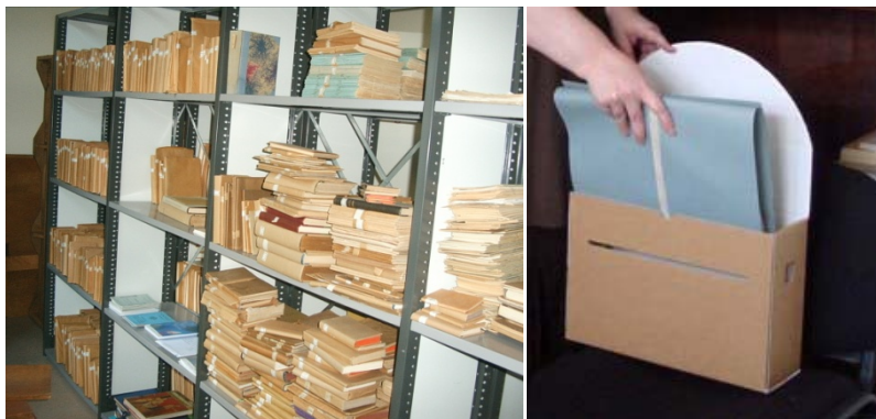
Links: toestand van het archief van Le Droit Humain voor inventarisatie, 2009.