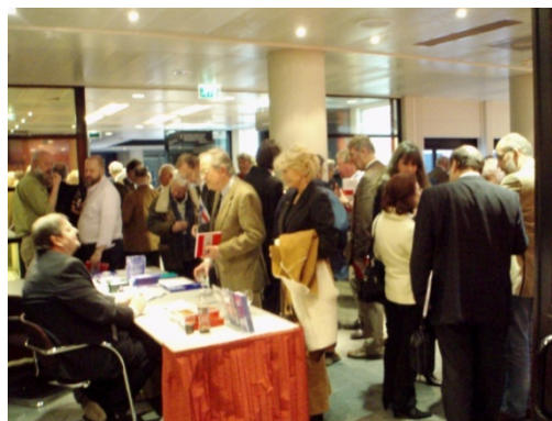
Penningmeester aan de informatietafel bij OVN-congres.

De recente uitbreiding van het bestuur met een Belgische vertegenwoordiger zal hopelijk de banden tussen Vlaamse en Nederlandse onderzoekers in het vakgebied versterken.